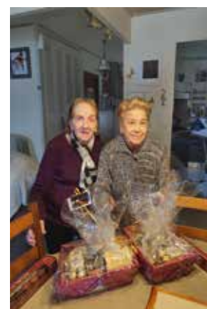
- nos anciens -